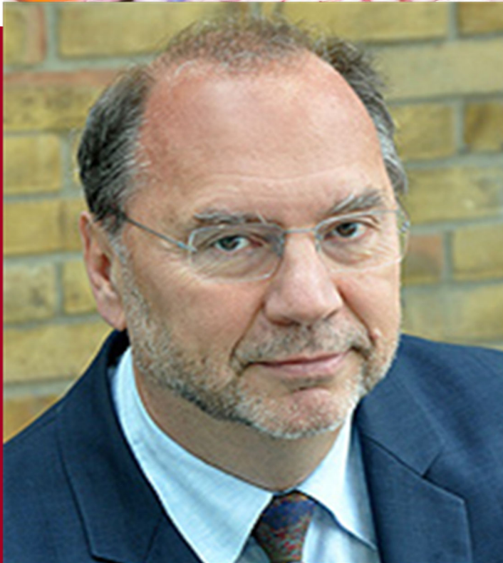
Prof. Sir Peter Piot Professor, Global Health London School of Hygiene & Tropical Medicine (LSHTM)

○欧州委員会委員長 COVID-19 特別顧問、 ○UNAIDS 初代事務局長、○国際連合事務次長 など要職を歴任。受賞多数。